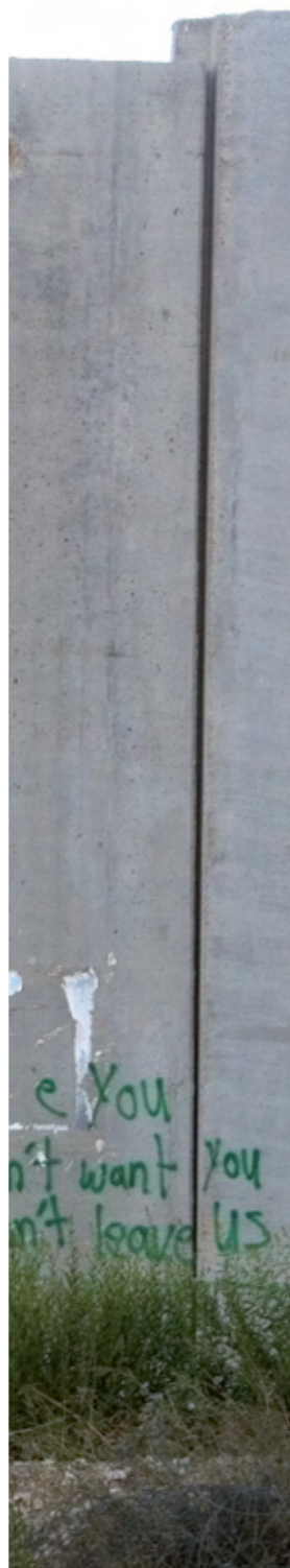
Tekst: Sølvberget KE, Utforming: Uniforum